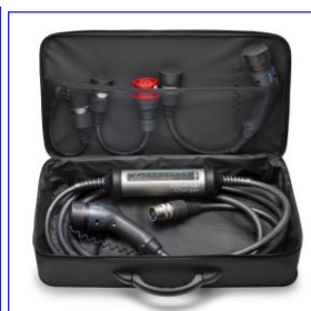
Súprava s nabíjacou jednotkou pre zapojenie do viacerých druhov elektrickej siete (230V/380V/WallBox) 98 460 313 80