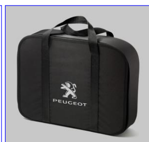
Taška na nabíjacie káble Peugeot 98 493 006 80