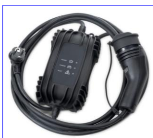
Štandardný kábel pre zapojenie do domácej 230V zásuvky 98 467 444 80