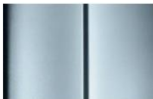
Réf. : COLOR_4FM0 Sívá Artense