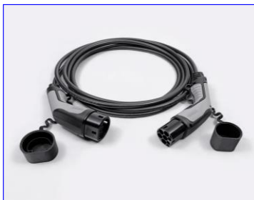
Kábel režimu 3 pre pripojenie do nabíjacej stanice (domáceho WallBoxu alebo verejnej stanice)