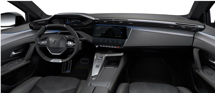
GT - palubná doska s chrómovým dekorom a zeleným prešíváním