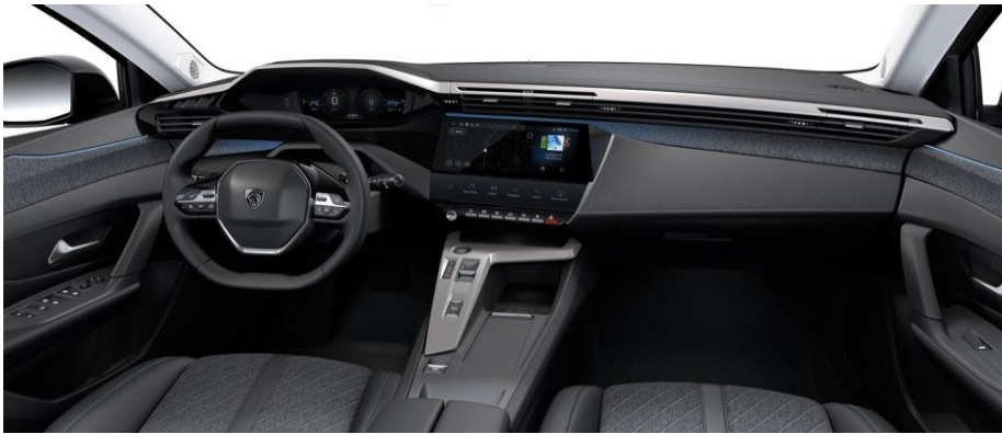
ALLURE / ALLURE PACK - palubná doska s dekorom TEXA