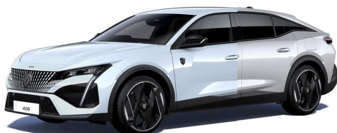
Biela OKENITE / Biela NACRÉ (3)