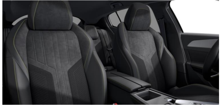
GT - štandardný poťah ALCANTARA FRAXX KNIT (DBFX)