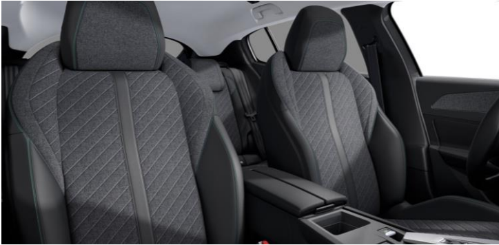
ALLURE, ALLURE PACK - štandardný poťah FRACTIL (U3FX)