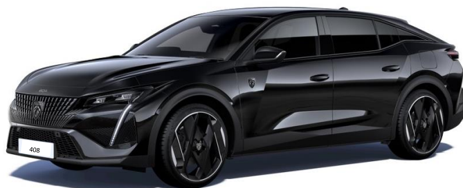
Čierna PERLA NERA