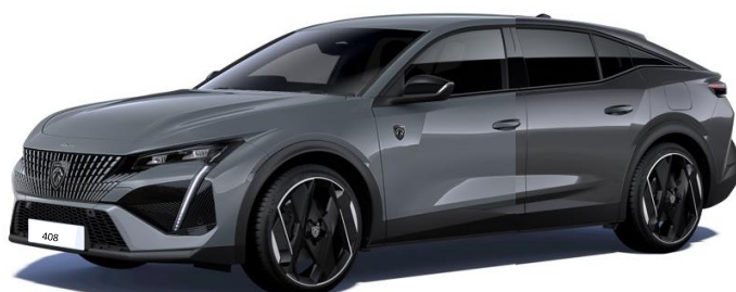
Sivá SELENIUM / Sivá TITANE (3)